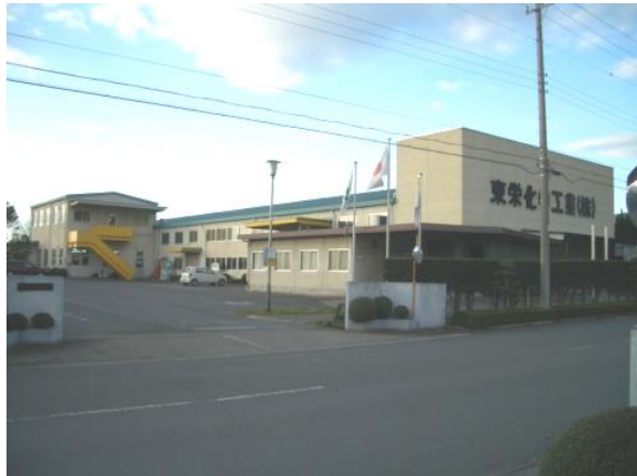
【 本社工場 】

近年は、第三種医療機器販売業の許認可を取得され、産学連携等を活用し、現場(医師)のニーズに応えた医療機器の開発に力を入れている。